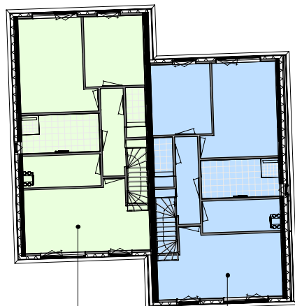
Woningtype WV1 Bouwnummer 71